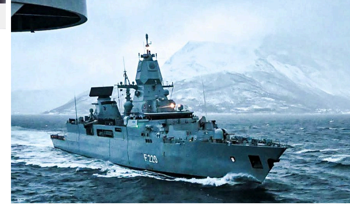
Parlamentul European: Regiunea arctică nu ar trebui să fie militarizată