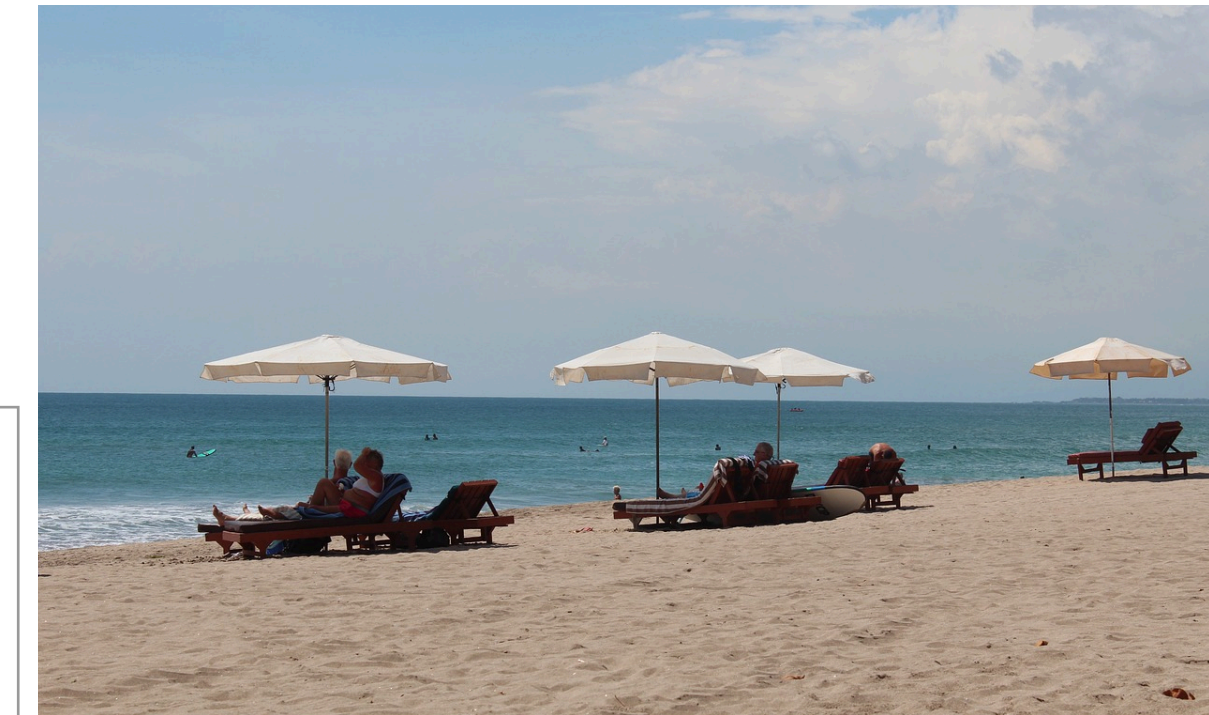
33 de plaje dintre cele mai vizitate din sudul Mediteranei ar putea dispărea în următorii ani