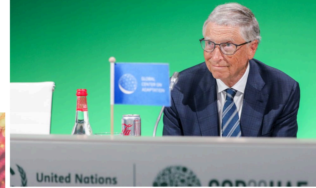
Bill Gates avertizează că lumea „a făcut un pas înapoi”. „Următorii cinci ani vor fi dificili”